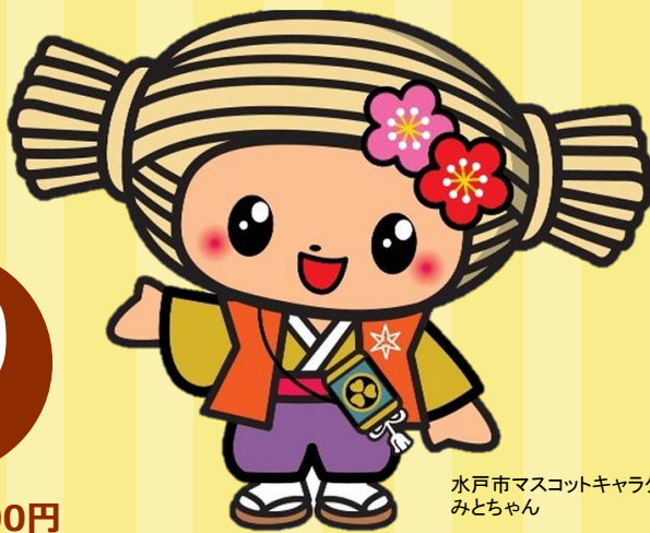
水戸市マスコットキャラクター みとちゃん